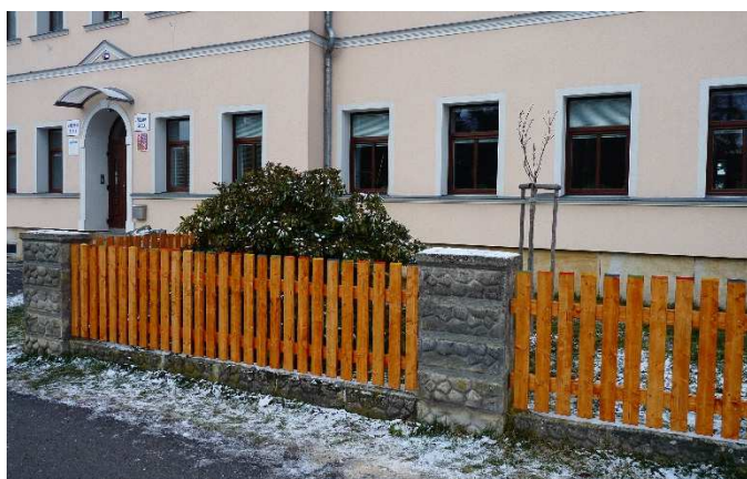
Díky iniciativě rodičů, dobrovolné práce rodičů, dětí i personálu školy, za finančního příspěví rodičů a obce byl v těchto dnech instalován nový plot u školy. Odstín plotu jsme oproti původnímu zesvětlili a decentně si vyhráli s barevným zkosněním plotovek. Výsledek je zdařilý a dětem se líbí!