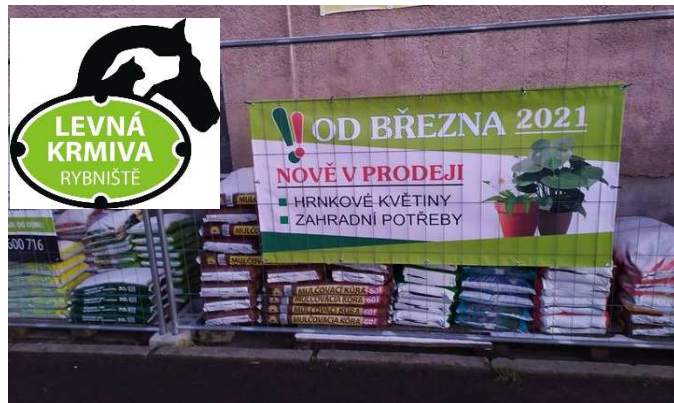
Levná krmiva Rybníště chystají na příští sezónu rozšíření sortimentu pro zahradní kutily.