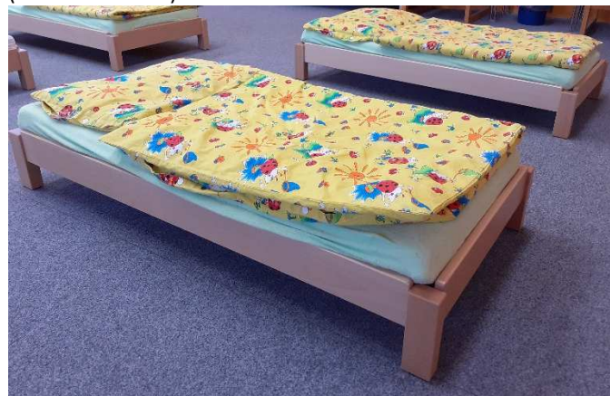
Hezké postýlky na odpolední odpočinek dětí.

Uzavření budovy se nám podařilo využít k vymalování skladové místnosti ve II. poschodí a k výměně nábytku v ložnici MŠ (skříň a lehátka).