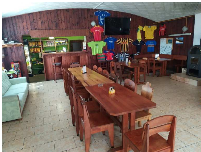
Upravený interiér klubovny.