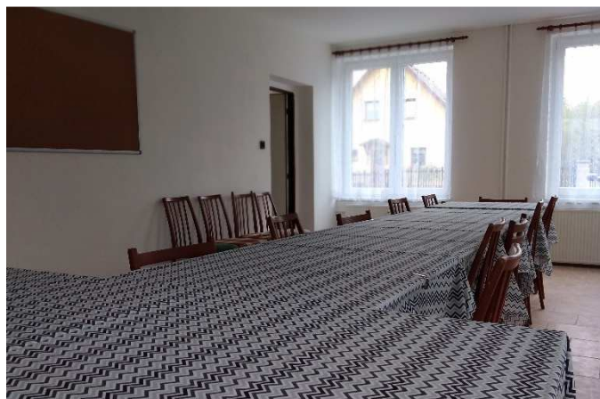
Klubovna hasičů prokoukla...