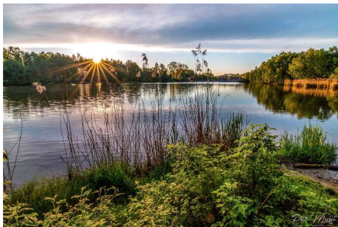
Začínající ráno u Školního rybníka zachytil fotograf Petr Musil.

https://www.obecrybniste.cz/zivot-obci/sportovni-rybolov/