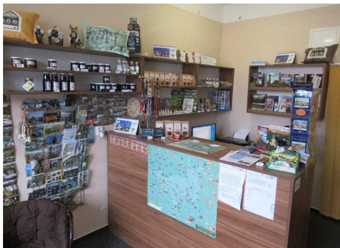
Chřibské íčko je příjemné a útulné.