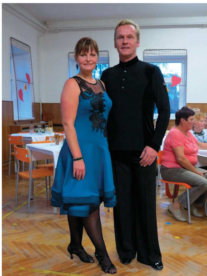
O úžasné taneční vystoupení se postarali manželé Vytlačilovi.