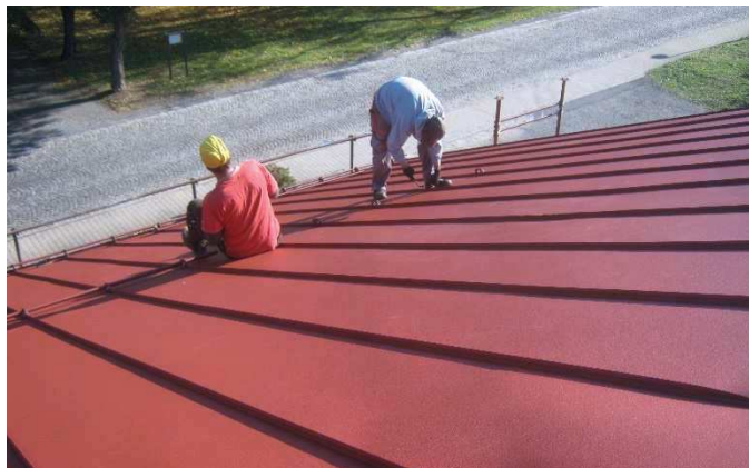
Montáž sněhových zábran