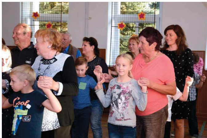
Pojď babičko na mazurku, já si s tebou dupnu 😊