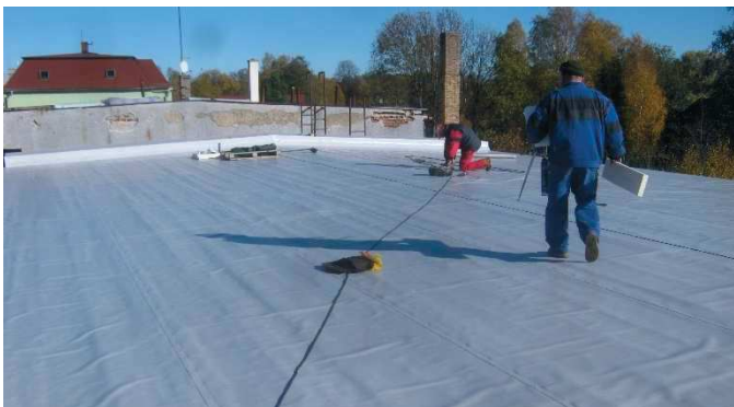
Dokončovací práce při vaření fólie nad sálem „kulturáku“