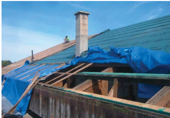
Pohled do „útrob“ střechy samoobsluhy při výměně vaznic.