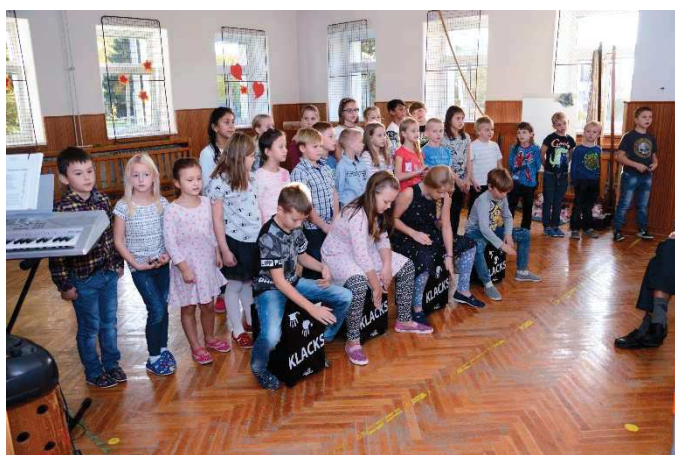
Pěvecké vystoupení s hudebním doprovodem a bubnováním.