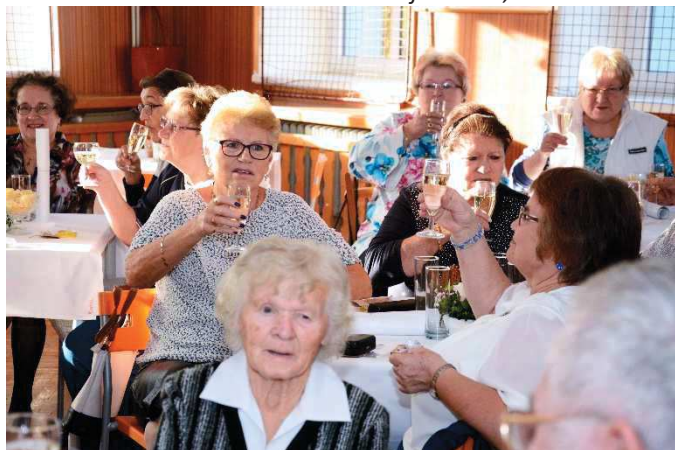
Připijíme vám na zdraví!