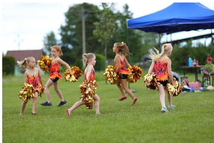
Malé Pomkies v akci.