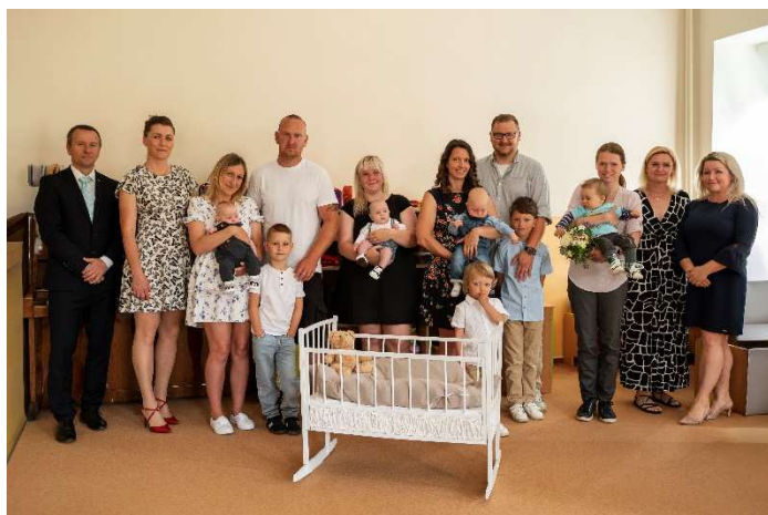
Společné foto vedení obce, vedení školy a přivítaných miminek s doprovodem. (Foto: Alena Bafiová).