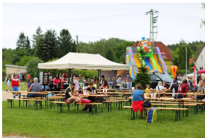
Celý park jsme zaplnili.