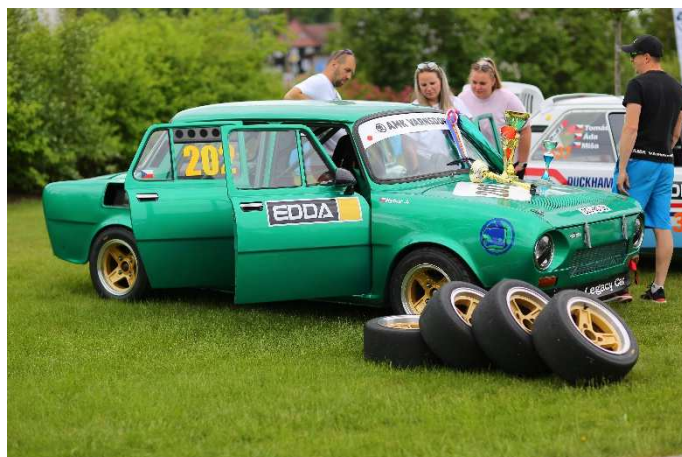
Závodáci od Amk Varnsdorf.