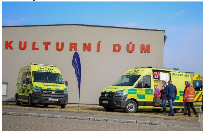
Převzato z TZ ÚK, města Rumburk (foto: ÚK, město Rumburk)

Nechyběly ani informace o investicích v regionu a na závěr setkání si účastníci mohli prohlédnout také nová sanitní vozidla, která budou sloužit na výjezdových základnách po celém kraji.