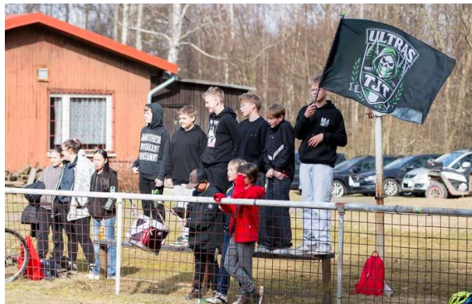
Hlasitá fanouškovská základna „Ultras TJT“