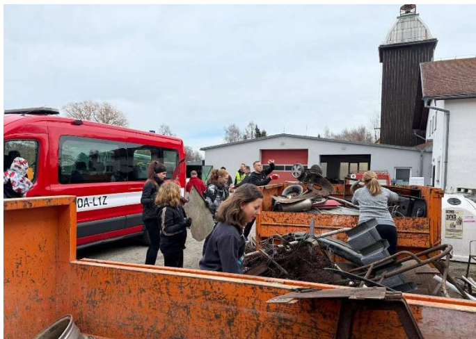
Pomáhali i děti z družstva starších a naši dorostenci.

Ke sběrové akci v sobotu 14.3., která pomohla vyčistit sklepy, zahrady, kůlny od nepotřebných spotřebičů a kovového odpadu, se připojily tři desítky domácností. Hasiči přerovnali šest plných kontejnerů kovového odpadu a spoustu elektrospotřebičů, který se likviduje ve spolupráci se společností Elektrowin.