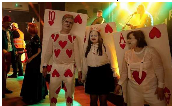
Vítězné masky byly vskutku parádní!