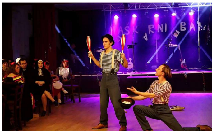
Kejklířské vystoupení také bavilo. (Text i foto Děčínský deník)