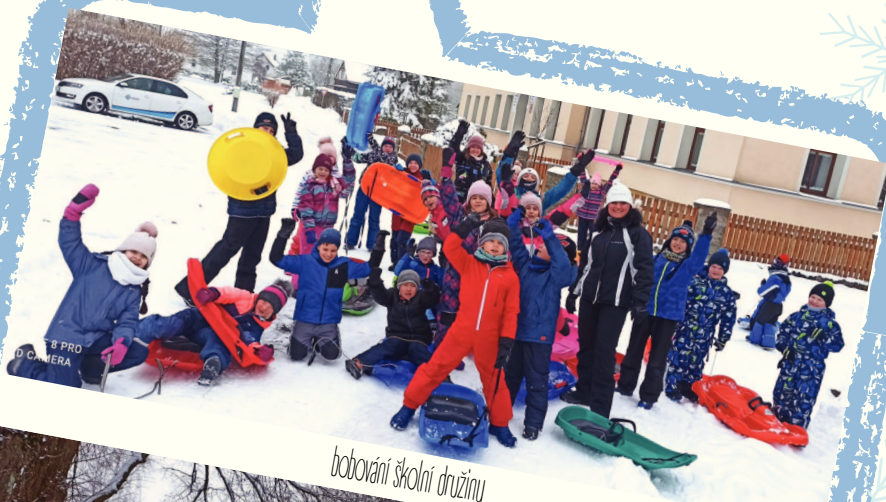
bobování školní družiny

více ve fotogalerii na www.zsrybniste.cz