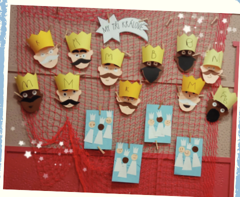
práce dětí z mateřské školy