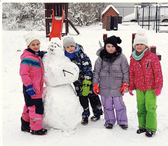
předškoláci a jejich sněhulak