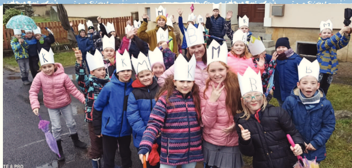
tříkrálový průvod školní družiny po obci