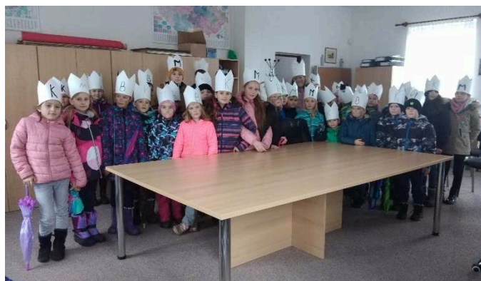
Tříkrálová návštěva na obecním úřadě.