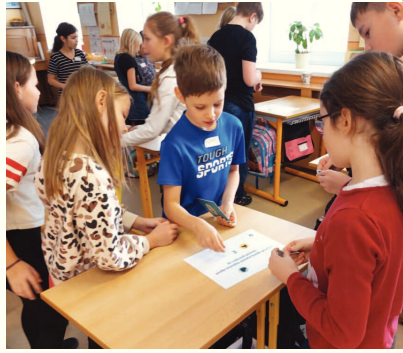
Dobronauti opět v naší škole - mise "hvězdný tým" úspěšně splněna...