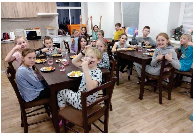
Společná večeře, všem moc chutnalo!

To, co v reportáži už není, se odehrávalo v kulturním domě. Děti mlaskaly u společné večeře, kterou jim navářila Restaurace Kulturní dům. Připravily si své dočasné pelíšky. Zabavily se u pracovních listů, které pro ně připravila ZŠ a MŠ Rybníště a které připomínaly letošní téma – českou malířku a ilustrátorku Helenu Zmatlíkovou. Pohádku na dobrou noc Z deníku kocourka Modročka, jehož podobu mu nezaměnitelně vtiskla právě paní Zmatlíková, přišla dětem přečíst nejužasnější babička Jana Klorová. Před usnutím se děti pochlubily úryvkem ze svojí oblíbené knížky a pak nastala ta nejtěžší část akce – USNOUT! Podle ranní aktivity dětí se dalo soudit, že si to společně užily! A to je nakonec pro nás největší odměna. Děkujeme za podporu a spolupráci: Lužická rybka, ZŠ a MŠ Rybníště, Restauraci Kulturní dům, studiu Vandej, Knihkupectví Papírová loď a hlídacím tetám Šárce, Maruše, Ilonce a Petře. Petra Vojtěchová, místostarostka