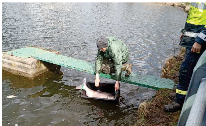
Ryby se do „Malasu“ opravdu vracely.

Oznamujeme, že známky na popelnici na letní období (od 1.5.2023 do 31.10.2023) bude možné zakoupit na obecním úřadě od 17.dubna.