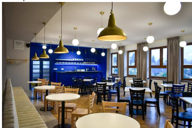
Líbivá realizace dle architektonického návrhu Studia Reaktor

Dne 18.11. v Dolním Podluží slavnostně otevřeli rekonstruované prostory kinokavárny v Bio Luž. Vznikl nový prostor pro komunitní setkávání, který bude sloužit pro pořádání občasných společenských i vzdělávacích akcí, využívat ho také mohou nejen spolky, ale i občané k pořádání rodinných oslav.