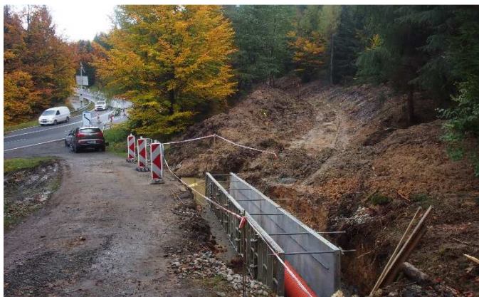
Napojení nové stezky na cestu k Jedlovskému nádraží.

Na straně k Jedlové jsou však budoucí stezky zatím „jen“ vykopané v terénu a momentálně připomínají spíše potok, který teče lesem z vrcholu „Šébru“ podél dvou pruhů až do levotočivé zatáčky, ve které je odbočka z hlavní silnice do lesa. Právě v tomto místě bude nově vznikající stezka začínat a napojí se na lesní cestu zvanou „Točna“ vedoucí k Jedlovskému nádraží, která je značená žlutou turistickou značkou.