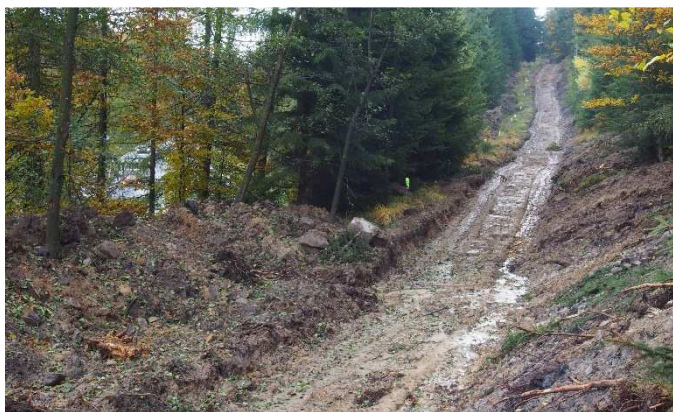
Nová stezka směrem na „Šébru“ (vlevo za stromy silnice I/9).

Dodavatel stavby řeší problém se zvodnělým podložím na této stezce, které se bude muset sanovat, s čímž nebylo v projektu uvažováno. Další oříškem pro stavbaře je doprava materiálu (kameniva) na tuto 650 m dlouhou stezku, která je v příkřejším svahu než přílehlý dvoupruhové stoupání na silnici I/9.