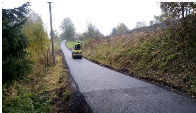
Válcování nově položeného asfaltu