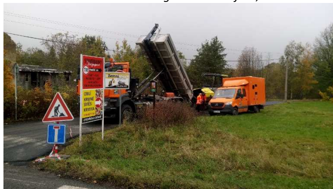
Pokládka asfaltu u výjezdu na hlavní silnici