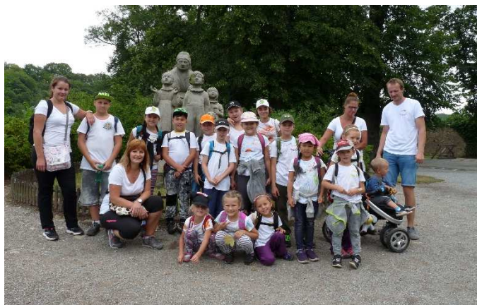
„Babička“ se všemi dětmi