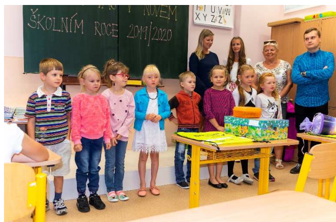
Naši letošní prvňáčci. Holčičí převaha je zřejmá.