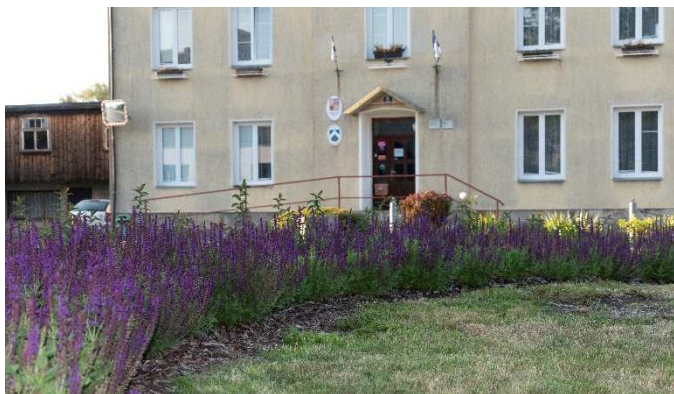
Nový parčík před úřadem. Levandulovým záhonům se daří.

Loni na podzim byl nově osázen parčík před úřadem. Aby vypadal pořádkem, vyžaduje pravidelnou péči, kterou mu nyní věnují manželé Chroustovští ml.. Moc děkujeme.