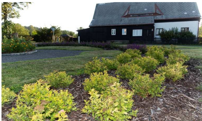
Kruhové záhony vypadají elegantně.