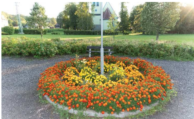
Afrikánový kruháček v obecním parku u dětského hřiště.