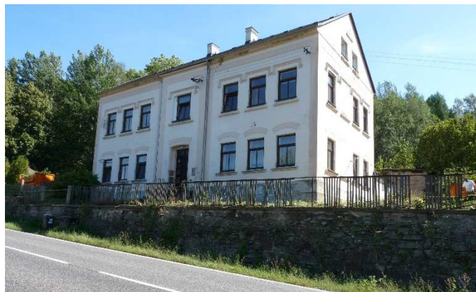
„Osvobozený“ bytový dům v Nové Chřibské.