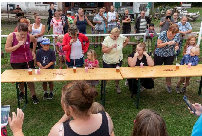
Některé disciplíny přilákaly mnoho povzbuzujících. Vypít pivo půlmetrovým brčkem není žádná legrace ☺