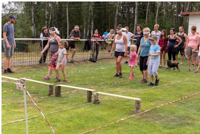
„Slepé báby“ se svým dětským doprovodem.