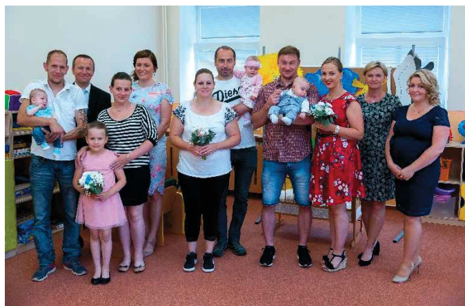
Vedení obce a školy s přivítanými dětmi a jejich rodiči.