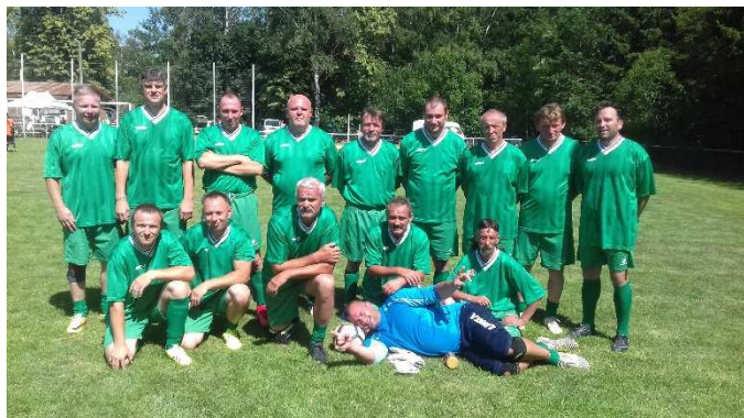
Naši stateční „zelení“ muži ☺