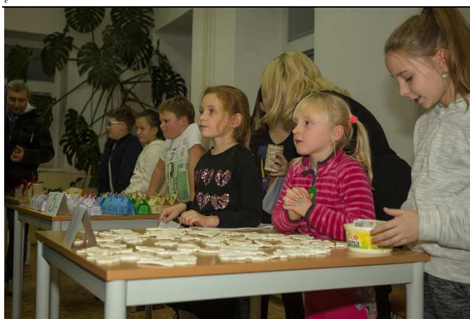
Do jarmarečního prodeje ve škole se zapojila spousta dětí a výborně spolupracovaly.