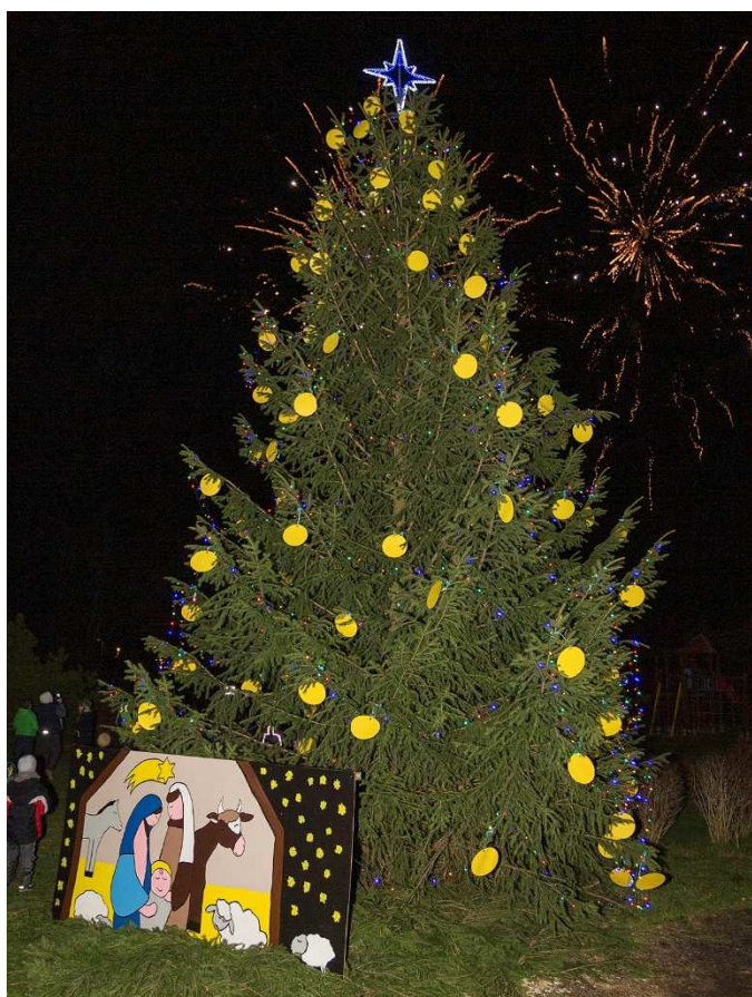
Betlém malovaný dětmi, ozdoby ze školní družiny, barevná světýlka a ohňostroj při prvním rozsvícení = náš stromeček!