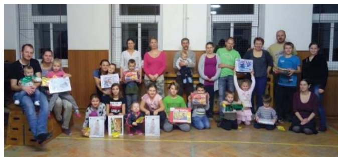
„Soptíková banda“ aneb členové a příznivci rybníšťských hasičů.

Celá akce se vydařila a všichni jsme odcházeli spokojeni domů. Všem zúčastněným a pomocníkům děkujeme.