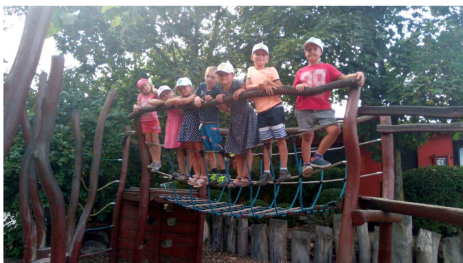
... i ve větvích