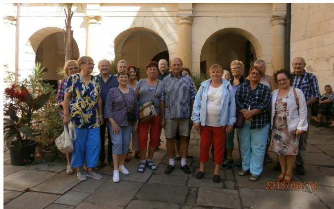
Společné foto na Sychrově.

někteří v prodejně s těmito šperky i utratili pár korunek. Z výletu jsme se vrátili spokojeni, protože jsme měli opět nádherné počasí.