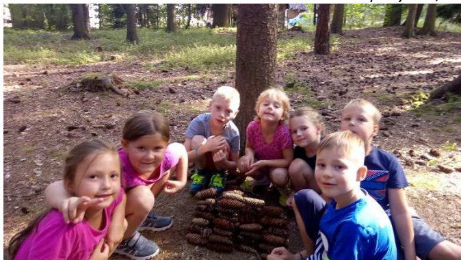
Malým hasičům se spolu dobře v lese...