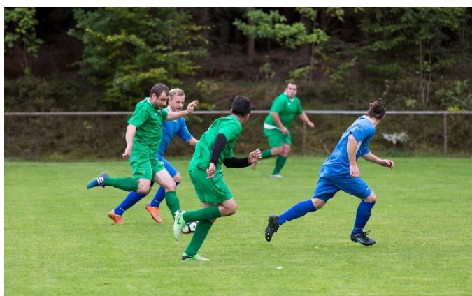
Záběry z utkání se Šluknovem „B“