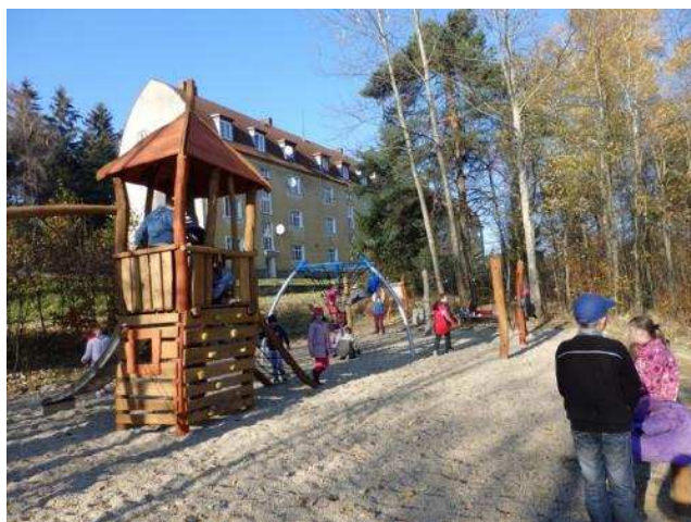
Dětské hřiště u Hangáru.