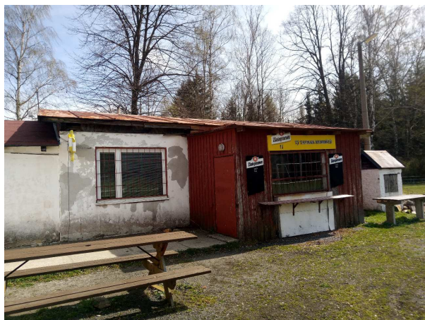
Pohled na klubovnu.

Obec je vlastníkem p.p.č. 227/1 v k.ú. Rybniště, kde se nachází sportovní areál s fotbalovým hřištěm a menším hřištěm, které lze využít např. na volejbal nebo nohejbal. Součástí areálu jsou šatny pro sportovce, sociální zařízení a klubovna. Obec tento areál bezplatně pronajímá Tělovýchovné jednotě Tatra Rybniště. V roce 2018 byl z rozpočtu obce dobudován zavlažovací systém a revitalizována travnatá plocha. V roce 2020 proběhla oprava střechy a zabráněno dalšímu zatékání do objektu.