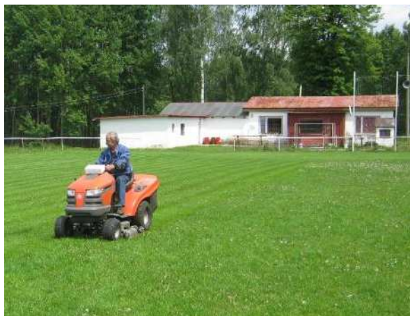
Celkový pohled na klubovnu a zázemí.