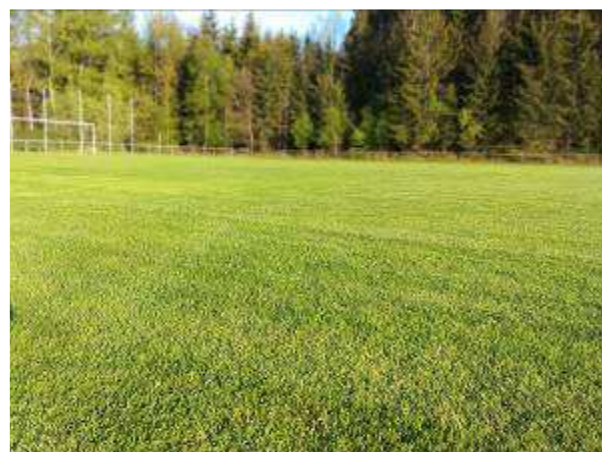
Trávník na ploše fotbalového hřiště v květnu 2020.

Obec je vlastníkem p.p.č. 410/1 v k.ú. Rybniště, kde se nachází plocha bývalého sportovního hřiště. V současné době je plocha využívána minimálně.