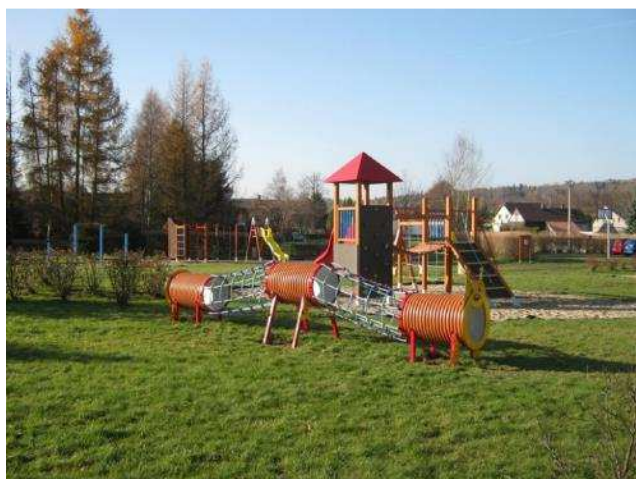
Dětské hřiště v centru obce.

V obci se nachází dvě dětská hřiště, jedno je vybudované v roce 2012 a druhé v roce 2015 – obě za přispění dotace z MMR ČR. Obec zajišťuje pravidelnou údržbu a drobné opravy. Obě jsou veřejně přístupná bez omezení. Všechny herní prvky podporují pohybovou aktivitu dětí a mládeže, rozvíjejí smysluplné trávení volného času v blízkosti bydliště a zdravý životní styl. Snižují riziko kriminality, zvyšují atraktivitu obce pro obyvatele i pro návštěvníky. Cílovou skupinou jsou děti od 3 do 15 let, jejich rodiče a prarodiče, kteří jistě ocení bezpečnost vybraných prvků a rozšíření aktivit dětí.