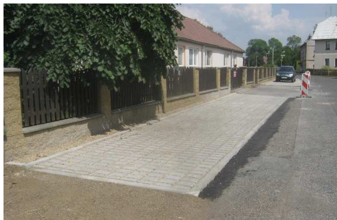
U „Pečovateláku“ byla důstojně opravena plocha k parkování

Na webové stránce www.virtualne-obcemicr.cz se můžete virtuálně projít po zajímavých místech naší obce a nahlédnout i k sousedům. Obce ve Šluknovském výběžku podpořily vznikající projekt virtuálních procházek obcemi České republiky a nechaly do nich nahlédnout okem speciální techniky... Ať se vám procházky líbí!