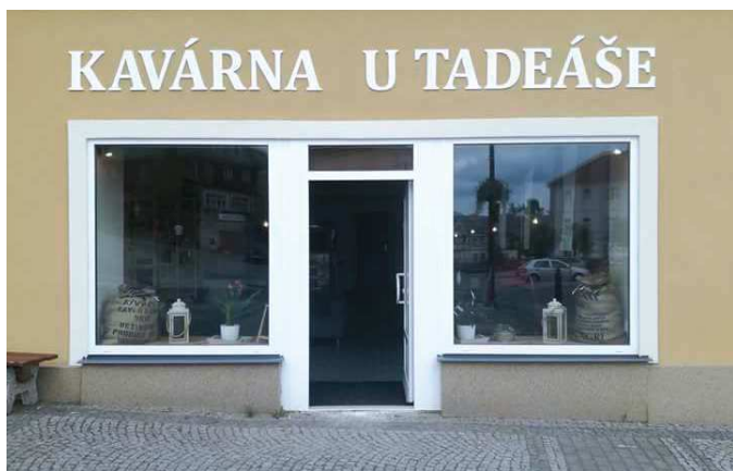
Přívětivý je také vchod do kavárny.

Město Chřibská otevřelo novou "Kavárnu u Tadeáše" v rekonstruovaných prostorách vedle Restaurace Radnice. Kavárna je jednoduše, ale přitom útulně zařízena a otevřeno má denně od 10 do 18 hod.. Dovází sem čerstvě praženou „Vilémovu kávu“. Pochutnáte si na výborných zákuscích nebo chlebičkách z rumburské Venezie.