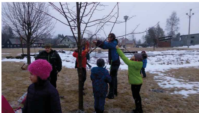
Soptíci svá vajíčka pověsili... a co vy? Taky jste se přidali?

Oddíl atletiky TJ Slovan Varnsdorf z.s. a Městské divadlo pořádají s grantovou podporou města Varnsdorfu 14. ročník běhu, pádění a úprku KDO UTEČE..., VYHRAJE! (aneb, od začátku..... do konce)