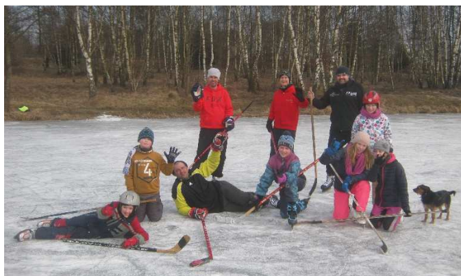
Letos se po letech hrál na zamrzlém „Malase“ zase hokej ...