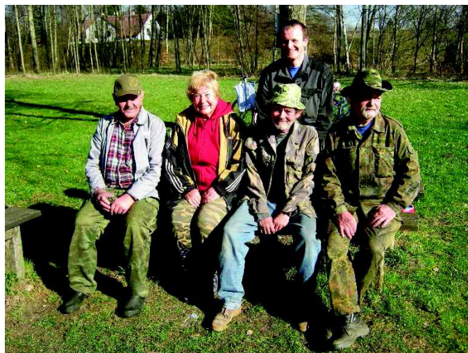
Rybáři při otevření sezóny rybolovu na Školním rybníku

Upozorňujeme, že na obecním úřadě jsou k dispozici známky na popelnici na období od 1.5.2017 do 31.10.2017.