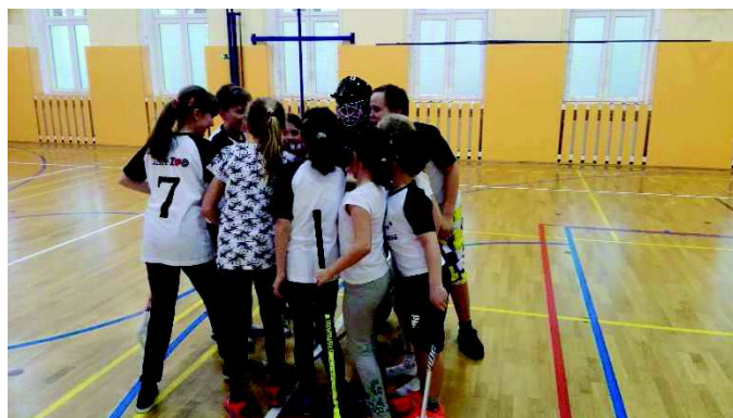
„Rybniště je nej...“, protože všechny porazej ... hej, hej!“