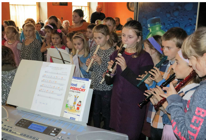
Flétničkové vystoupení dětí ze ZŠ Rybníště