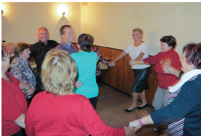
Starosta v jednom kole...

V pondělí 16.11.2015 bude Obecní úřad UZAVŘEN! Děkujeme za pochopení.