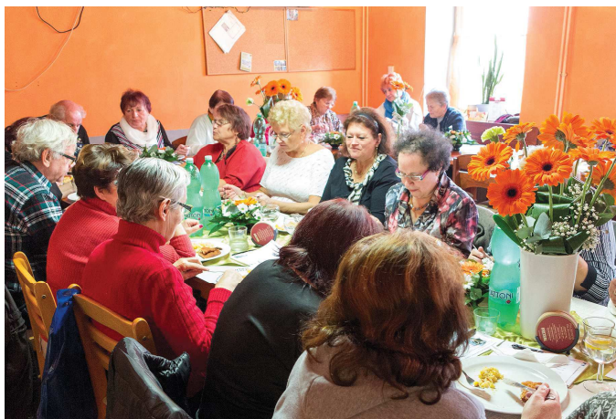
Seniory a seniorkami zaplněná restaurace Kulturní dům